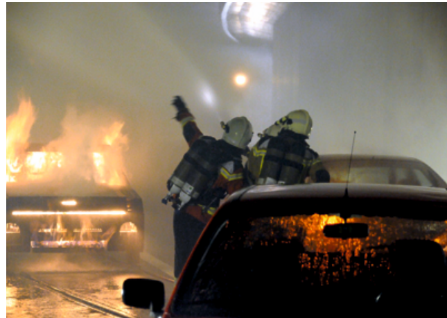
Live-Training mit Fahrzeugen

Für das Außengelände der ifa werden 2011 drei weitere Eisenbahnbrandstellen nach Balsthal geliefert werden.