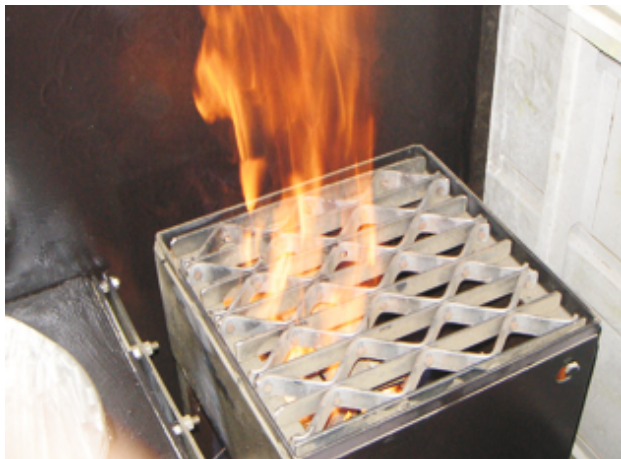
Papierkorbbrandstelle im Toilettenraum