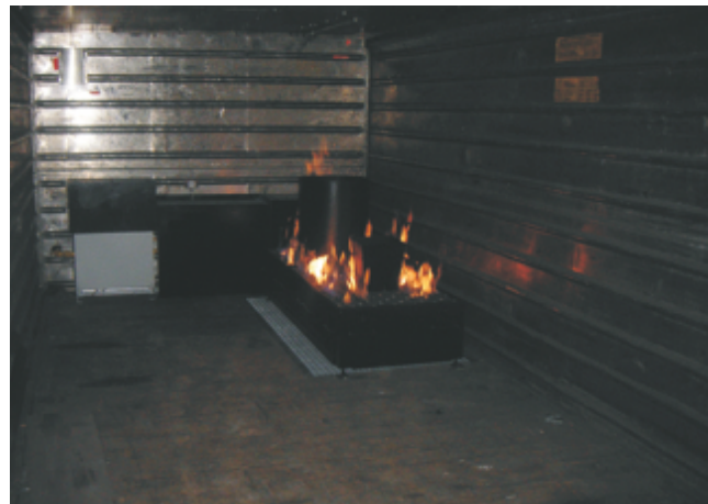
Universalbrandstelle in Güterwaggon