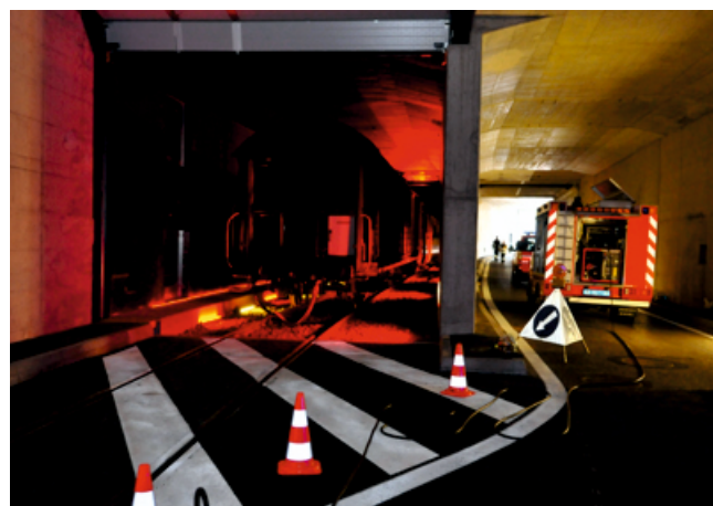
Live-Training mit Bahnwaggons