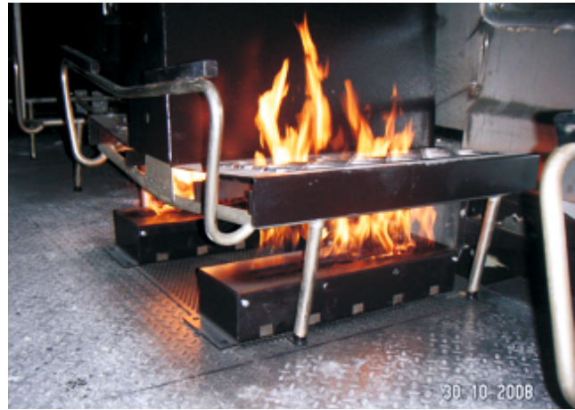
Sitzbrandstelle im Detail