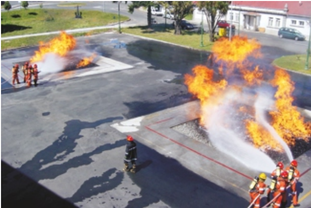
Beide Flächenbrände im Parallelbetrieb