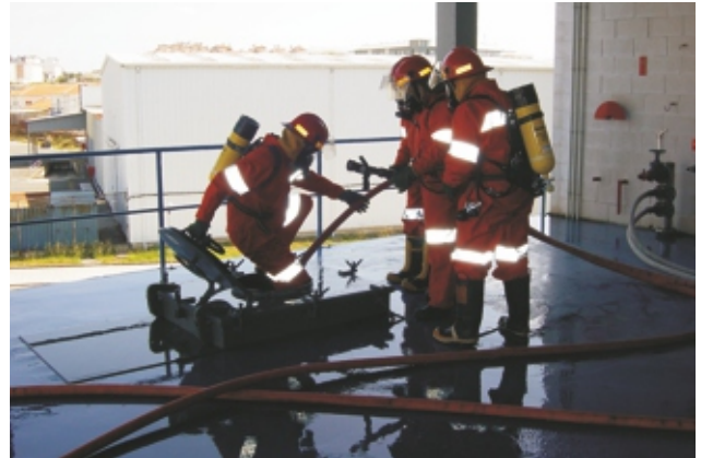
Einstieg durch Schiffs Luke